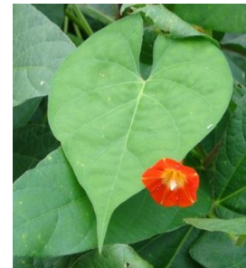
帰化アサガオ類 (マルバルコウ)